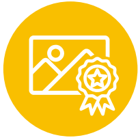
IMAGE QUALITY QUALITA' IMMAGINE

ReVision NET is able to catch details up to 10 \mu\text{m} by reproducing high resolution images as it is equipped with very high quality sensors and technology and an illumination system with CRI 90 light. The optics with very low image distortion and a passive system for the reflection reduction allow to provide the operator with images and colors faithful to the print without any alteration.